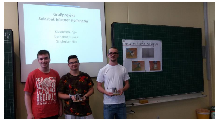
Projekt solarbetriebener Helikopter in Kl. 10aTPD