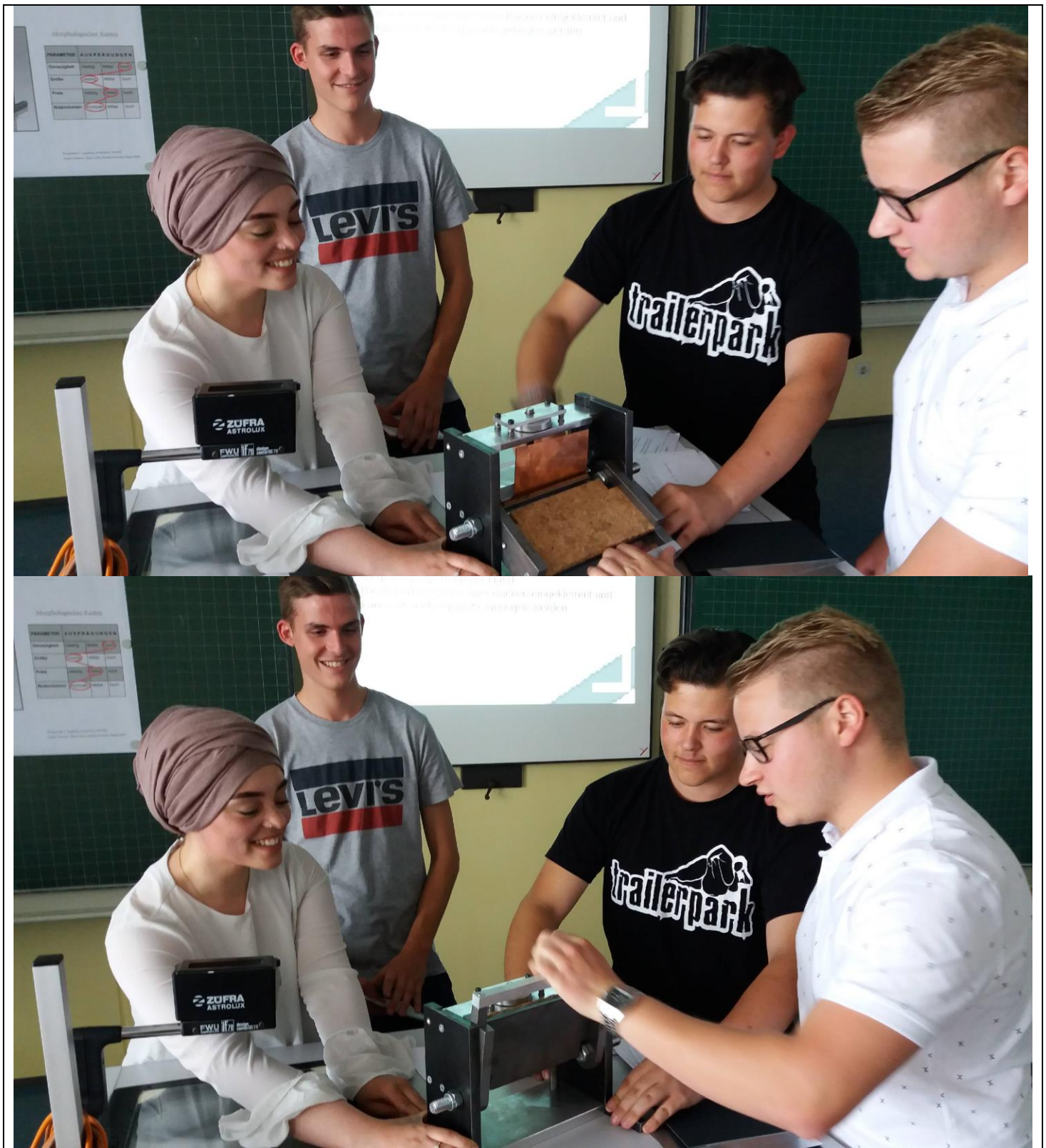
Projekt Biegemaschine in Kl. 10bTPD